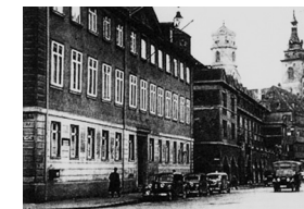
Ziel der Spur : Innenministerium Stuttgart.