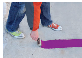
Die 10 cm breite violette Farbspur

Vom 13. bis 16. Oktober 2009 werden zahlreiche Hände unterschiedlichster Teilnehmerinnen und Teilnehmer einen „Gedankenstrich“ von Grafeneck bis Stuttgart malen – und damit unterstreichen, dass alle Menschen das gleiche Recht auf Leben haben.